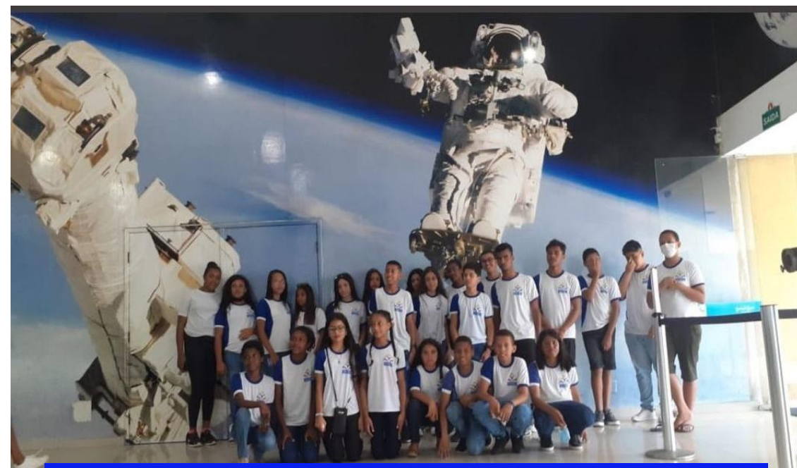
AULA DE CAMPO – MUSEU OBSERVATÓRIO ANTARES – FEIRA DE SANTANA