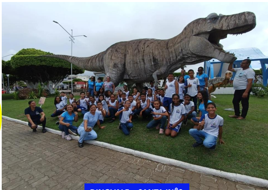
DINOVALE – SANTA INÊS

A participação ativa dos estudantes e de seu papel no processo coletivo e colaborativo de construção e apropriação dos saberes, atitudes e práticas, em uma perspectiva de progressiva autonomia. A construção de arranjos locais de integração da escola com o território e com a comunidade social de que faz parte, na perspectiva do reconhecimento e da mobilização de seus saberes e práticas socioculturais.